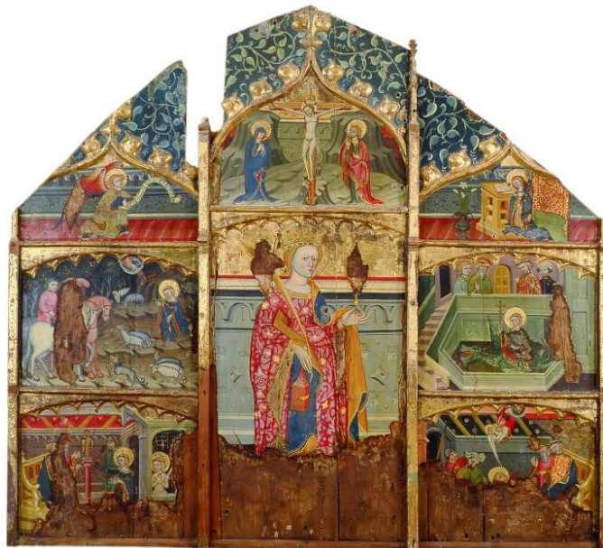
Retaule dedicat a santa Margarida Vic (?), primera meitat del s. XV Pintura al tremp sobre fusta. 159,5 x 175,5 cm Provinent de l'església de Santa creu de Fonollosa (Bages)